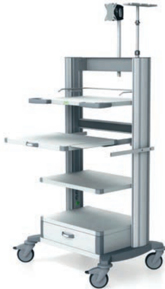
toro 63 Endoskopiewagen 3