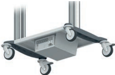
Unterbau-Trenntrafo RU 1120