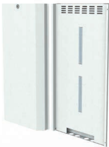
Rückseitenabdeckung „comfort“ für toro 45 + 63