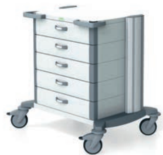
tore 63 Narkosewagen