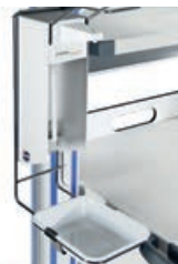
Sensor-Spender für 1 L-Flaschen