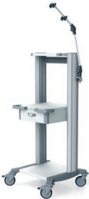
toro 45 Ergometriewagen