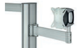
„alegro“ Monitorhalter auf Gelenkarm