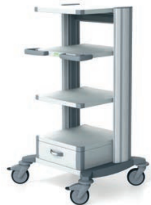
toro 45 Gerätewagen 2