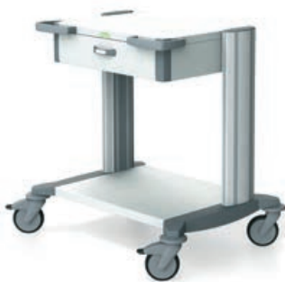
toro 63 Basiswagen