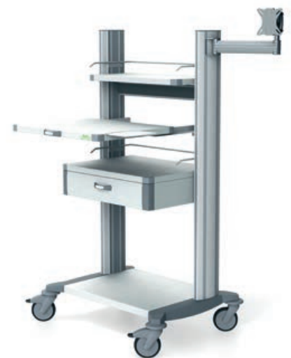
toro 63 Computerwagen 4