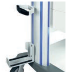
Halterung für Sauerstoff-Flasche 5/10 L