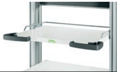
Platte + Reling für toro 45