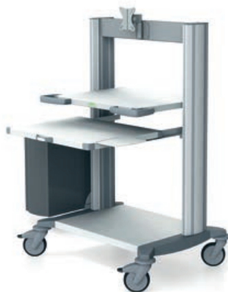
toro 63 Computerwagen 1