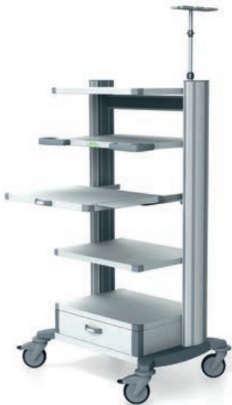
toro 63 Endoskopiewagen 2