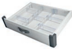
Schublade + Einsatz mit variablen Einteilungen