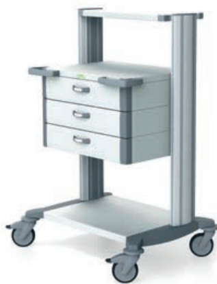
toro 63 Notfallwagen