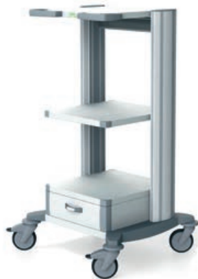
toro 45 Gerätewagen 1