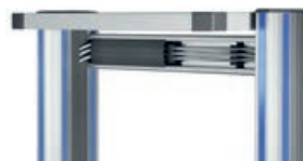
Kabelkanaltraverse für toro 45 + 63