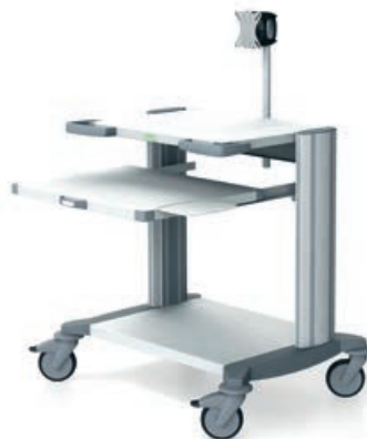
toro 63 Computerwagen 3