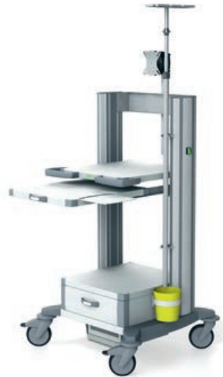
toro 45 Endoskopiewagen 4