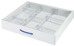
Schublade + Einsatz variabel