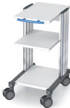
swingo® 45 in Holz-/Kunststoff Sonografiewagen