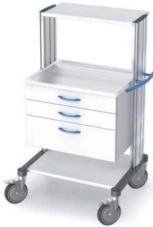
swingo®-clinic 60 in Metall Notfallwagen 2