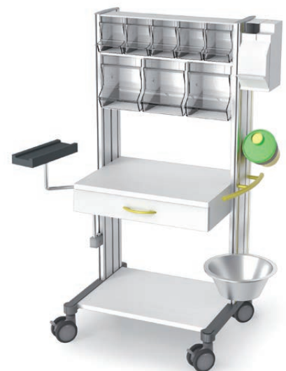
swingo® 60 in Holz-/Kunststoff Injektionswagen PicBox®