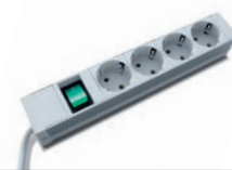
Steckdosenleiste 4-fach standard