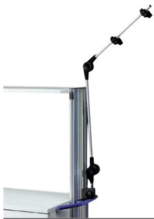
Kabel- und Schlauchhalter