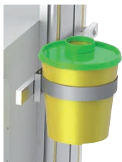
„Medi-Müll Set“ mit 20 Boxen 1,5 L