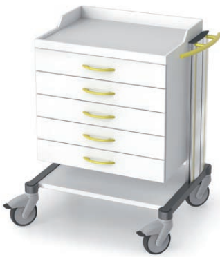
swingo®-clinic 60 in Metall Narkosewagen