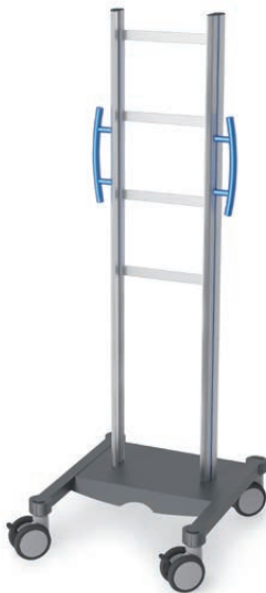
swingo®-clinic in Metall Infusionspumpenwagen