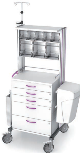
swingo® 60 in Holz-/Kunststoff Behandlungswagen