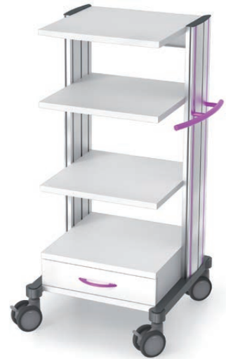
swingo®-clinic 45 in Metall Gerätewagen