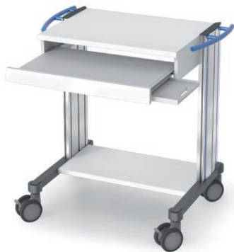
swingo® 60 in Holz-/Kunststoff Computerwagen