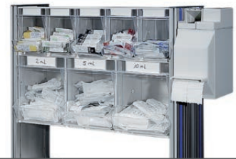
Injektionsset PicBox® + KOMBI-Set