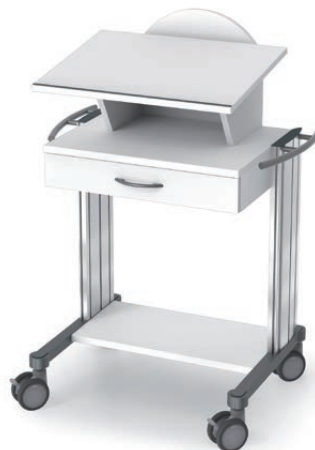
swingo® 60 in Holz-/Kunststoff Schreibpultwagen