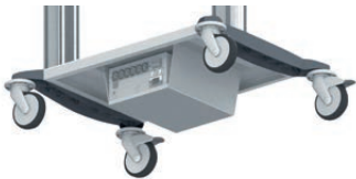
Unterbau-Trenntrafo RU 1120