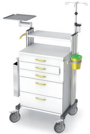
swingo®-clinic 60 in Metall Notfallwagen