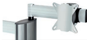
„alegro“ Monitorhalter auf Schwenkarm