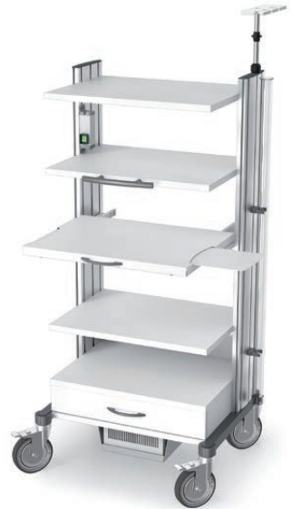
swingo®-clinic 60 in Metall Endoskopiewagen 60.2