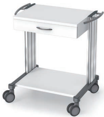
swingo® 60 in Holz-/Kunststoff Basiswagen